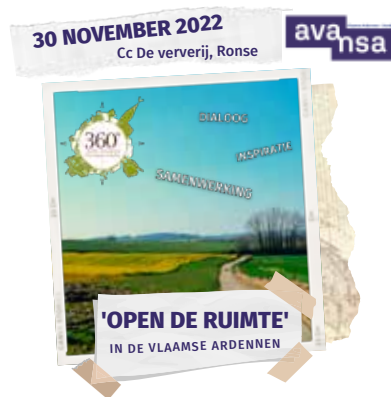
ONTMOETING TUSSEN BURGERS, BOEREN EN BESTUURDERS

Er wordt samen op zoek gegaan naar manieren om in te zetten op kwaliteit van het landschap en de leefomgeving in de Vlaamse Ardennen. Burgers, boeren en bestuurders van binnen en buiten de regio getuigen over hun eigen initiatieven en nemen je mee in hun aanpak en ervaringen. Zo zie je de open ruimte eens door de bril van een ander. Je gaat gegarandeerd vol energie naar huis en met inspiratie hoe jij mee het verschil kan maken. Samen geven we vorm aan het landschap van de toekomst en zetten we in op een aangename leefomgeving in de Vlaamse Ardennen.